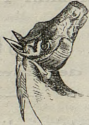
Lámina de grandes dimensiones compuesta de 80 grabados que representan todas las bellezas, defectos y enfermedades del caballo, siendo por lo tanto muy útil para los veterinarios y aficionados á aquel animal.

Se vende en la Administración de este periódico, calle de Mendizábal, núm. 20, 2.º