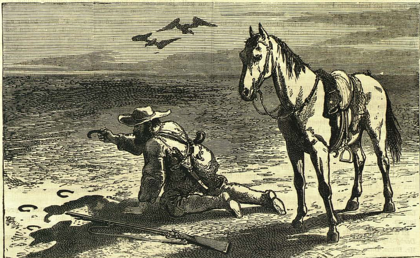
¡Este es el rastro de un traidor, ó tal vez de un asesino!...

Hace pocos días no pudo verificarse en Pamplona una